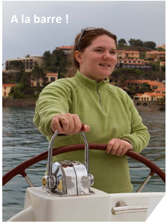
A la barre !