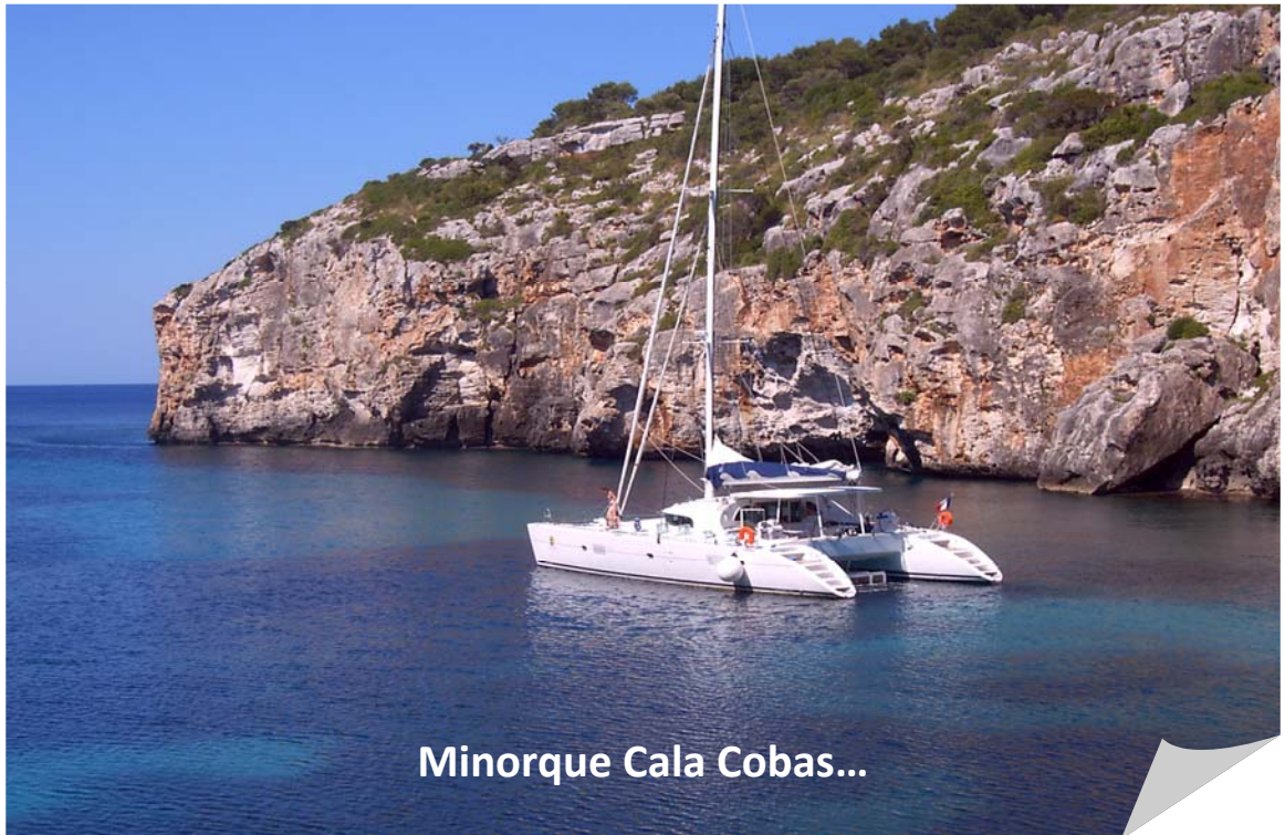
Minorque Cala Cobas...