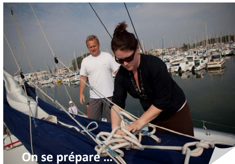
On se prépare ...