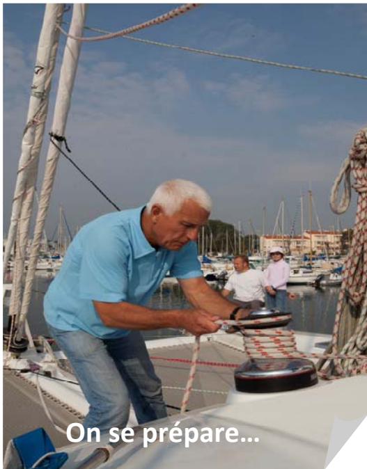
On se prépare...