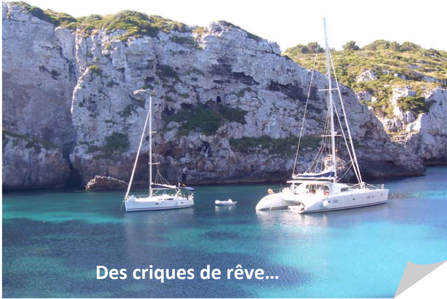
Des criques de rêve...