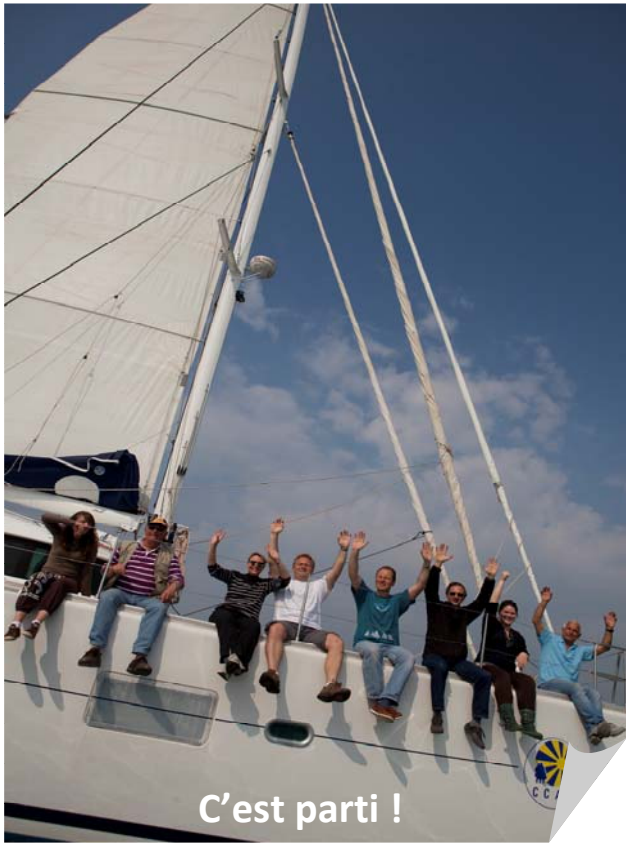
C'est parti !